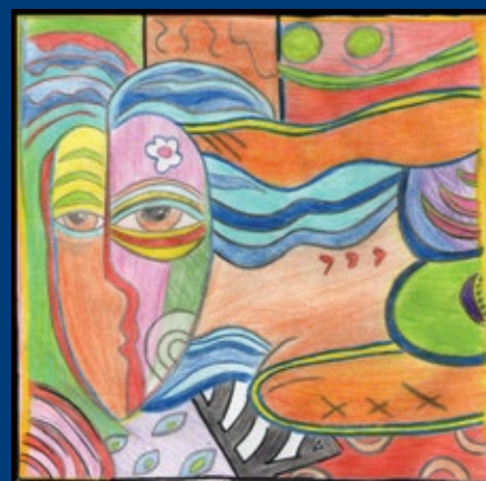
/// JELENA FILIPIĆ III, 3 ///

Ovi nadareni ljudi koji su živeli za umetnost i po svemu su bili izuzetni, otišli su sa ovog sveta na izuzetan način. Bilo da je to bila njihova sopstvena odluka, prkos ili izazov svetu, bilo da je odmazda sveta, pamtićemo ih i po delima i po neobičnim smrtima.