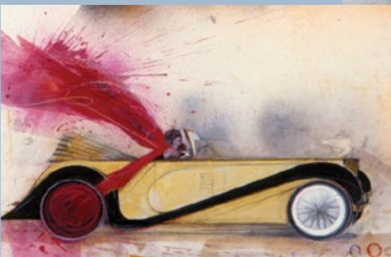
Olja Ivanjicki – Bugati, Isidora Dankan 1995.

Jesenjin se u lenjingradski hotel "Angleter" prijavio 25. decembra 1925. Dva dana nakon što se smestio, u nedostatku mastila, sopstvenom krvlju napisao je svoje poslednje stihove - pesmu Doviđenja, druže, doviđenja, koju je na ispresavijanom papiriću poklonio prijatelju, pesniku Volfu Erlihu. Veo magle obavio je događaje koji su se prethodne večeri odigrali u njegovoj sobi. Poznato je da se pesnik teško nosio sa surovom realnošću; utehu je tražio u alkoholu i mnogobrojnim ljubavnim aferama. Da li je sve to bilo razlog da donese kobnu odluku i okonča svoj život ili je postao žrtva sopstvenih političkih uverenja? Da li je te večeri zaista presekao vene ili je u pitanju iscenirano samoubistvo? Sledećeg jutra, crni čovek pronađen je obešen o cev grejanja.