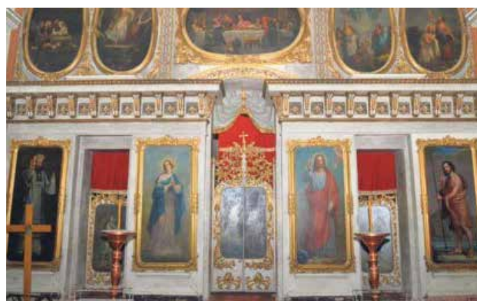
Иконостас у Јарковцу