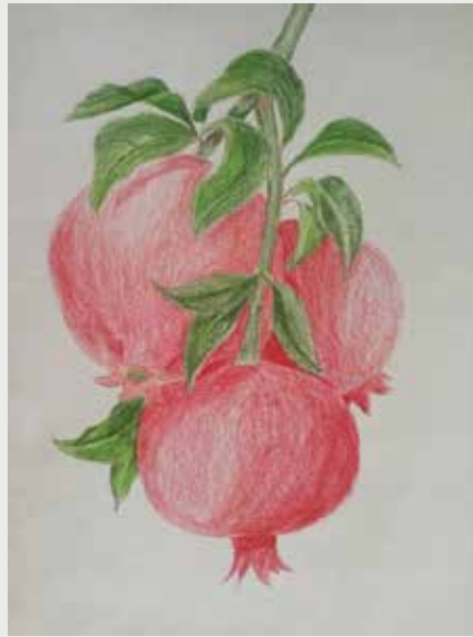
Наташа Ђетковић 1-4