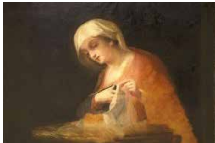
Богородица, по узору на Софију Дели

Данилова уметничка личност остаје изазов за